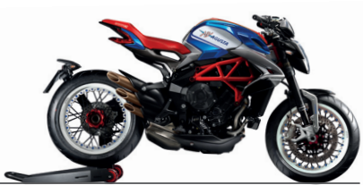
AMERIKA BLAU/WEISS/AGO ROT/TIEFSCHWARZ