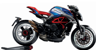
BLU AMERICA/BIANCO/ROSSO AGO/ NERO INTENSO