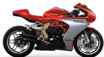
ROSSO SHOCK PERLATO/ARGENTO AGO/ CARBONIO