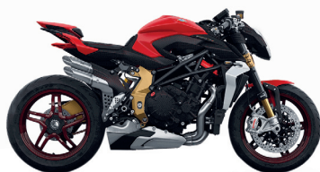
ROSSO SHOCK PERLATO OPACO/ ARGENTO F4 AGO OPACO/ CARBONIO CON FILO ROSSO OPACO