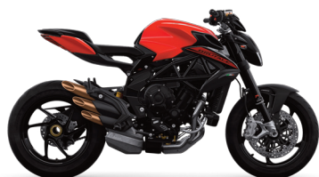
ROSSO AGO/NERO CARBON METALLIZZATO