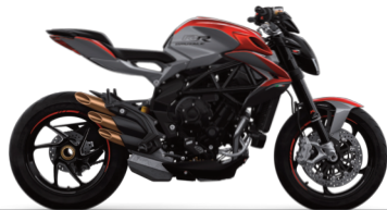
ROSSO SHOCK PERLATO/GRIGIO AVIO