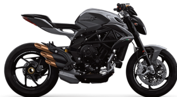
ARGENTO AGO/GRIGIO SCURO METALLIZZATO