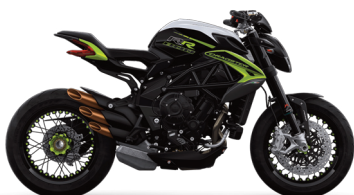
BIANCO ICE PERLATO/VERDE NEON NERO CARBON MET