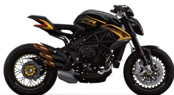
GRIGIO NOTTE/SOLAR BEAM/NERO CARBON MET.