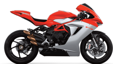
Rosso Ago/Argento Ago