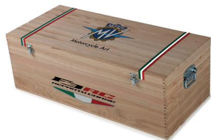
F3 800 RC - RACING KIT**