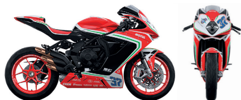
ROSSO MAMBA/NERO CARBON METALLIZZATO/ BIANCO PERLATO RC/VERDE