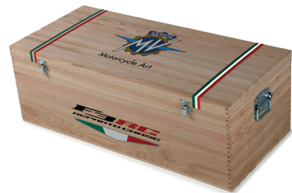
F3 800 RC - RACING KIT**