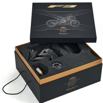
DEDICATED KIT F3 RR*