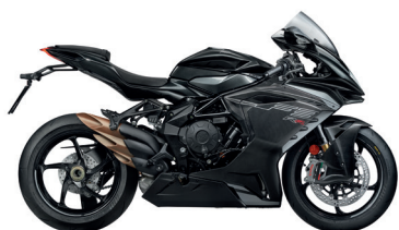
NERO CARBON METALLIZZATO/ GRIGIO SCURO METALLIZZATO