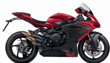
ROSSO FUOCO OPACO/ GRIGIO SCURO METALLIZZATO OPACO